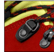
HAIX® 2-Zone Lacing